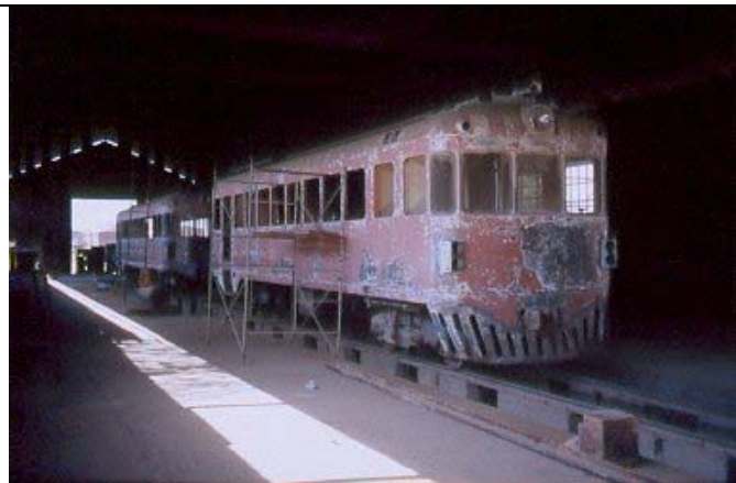
Der Ferrobús mit seinem Acoplado (Beiwagen, im Hintergrund) in der Werkstätte von Cochabamba

Dies zeigt auch schon, was an Reparaturen und Arbeiten anfällt: Ersatz des Motors durch einen Volvo Motor, Revision der Drehgestelle, Außenanstrich, Neue Innenverkleidung und neue Bodenbeläge, Einbau der vorhandenen Fenster, Türen und Sitze, wobei die Sitze wahrscheinlich neue Bezüge bekommen müssen. Einbau einer Heizung/Klimaanlage und eines Lautsprechersystems. Einbau einer Chemietoilette und einer neuen Kücheneinrichtung, sowie eines Kühlschranks im Vorratsraum.